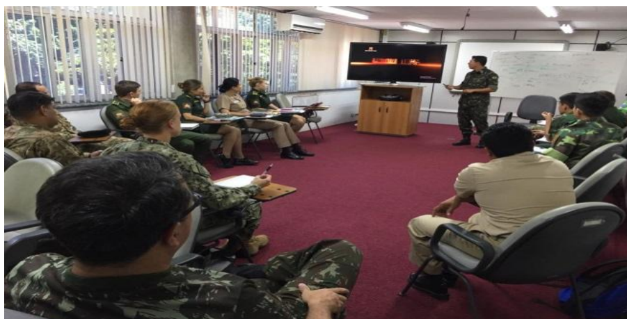
Figura 2 – CPME / EIPA em sala de aula.