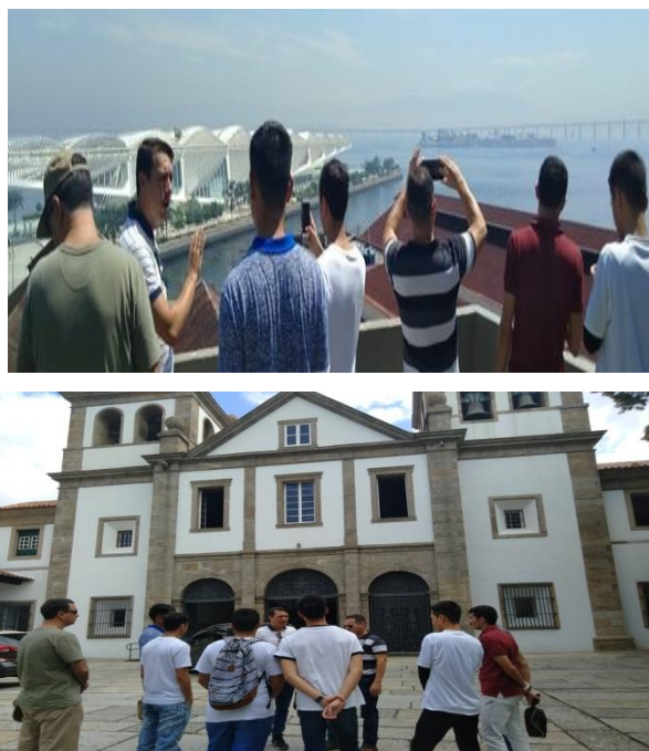
Figura 3 – CPME / EIPA na aula-passeio.

O espaço é, então, um verdadeiro campo de forças cuja aceleração é desigual. Daí por que a evolução espacial não se faz de forma idêntica em todos os lugares (SANTOS, 2002, p. 153).